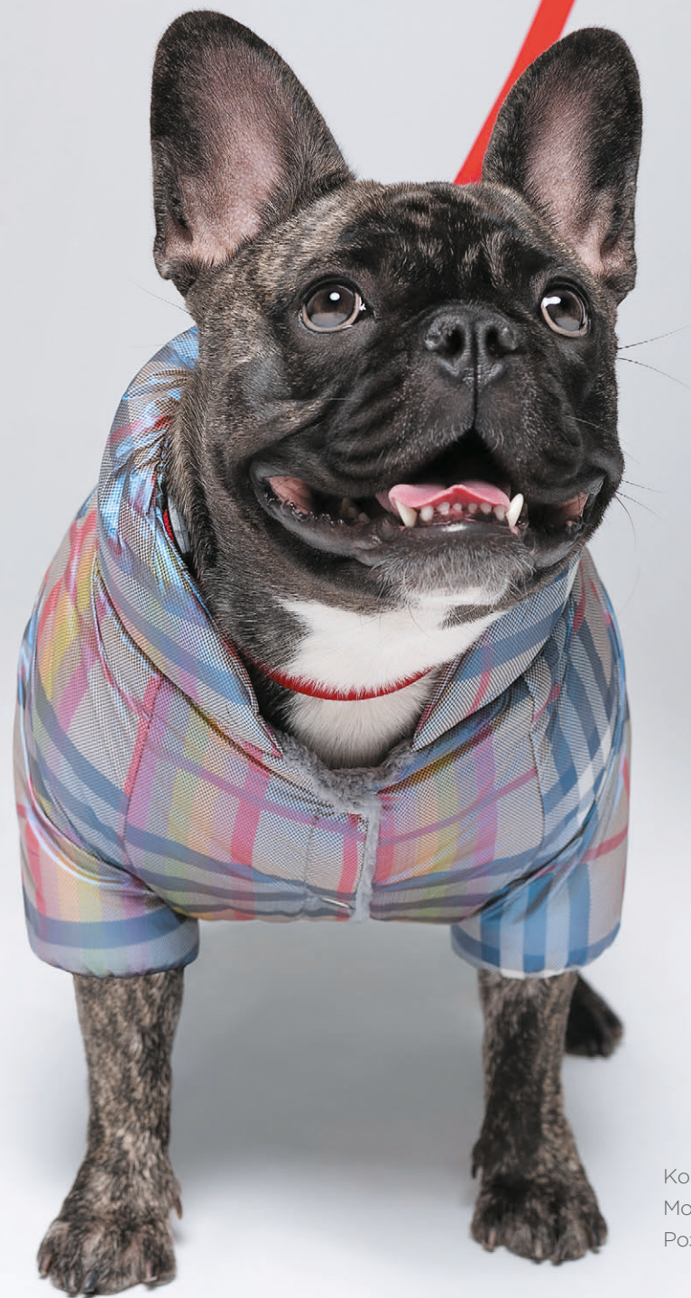
Комбінезон: INDIGO картатий Модель: бульдог ХАРЛІ Розмір: M2